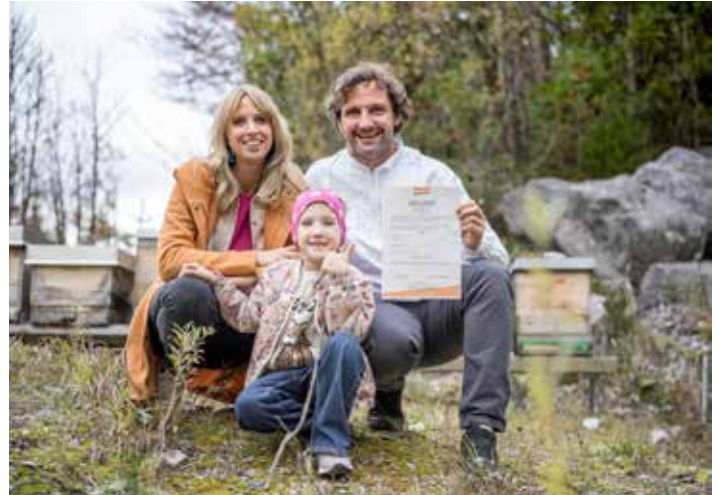
Familie Defrancesco aus Waidring produziert Demeter Honig von höchster Qualität.

In einer Zeit, in der Nachhaltigkeit und Umweltschutz an Bedeutung gewinnen, setzt Roland aus Waidring ein positives Zeichen. „Genießen Sie unseren einzigartigen Honig und unterstützen Sie uns dabei, die Natur zu bewahren – jeder Löffel zählt!“