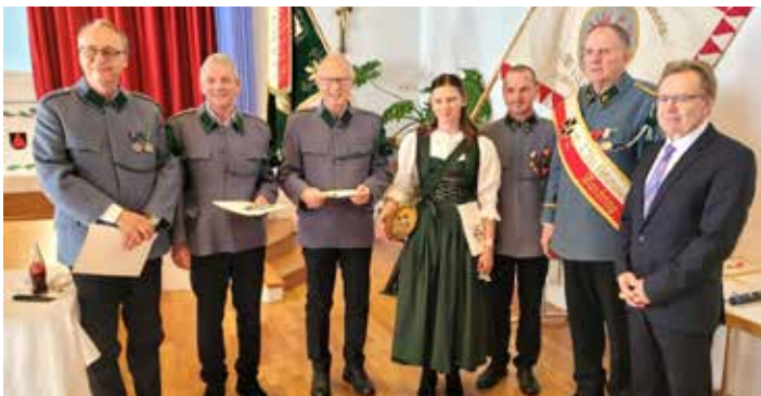
Neue Mitglieder verstärken den Verein.