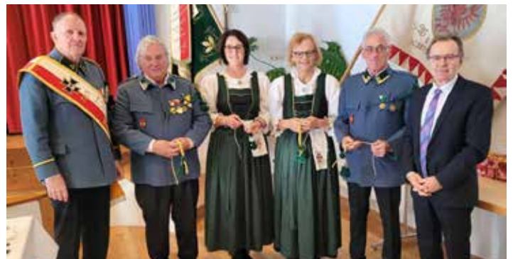
Verleihung der Schützenschnüre in Gold und Silber.