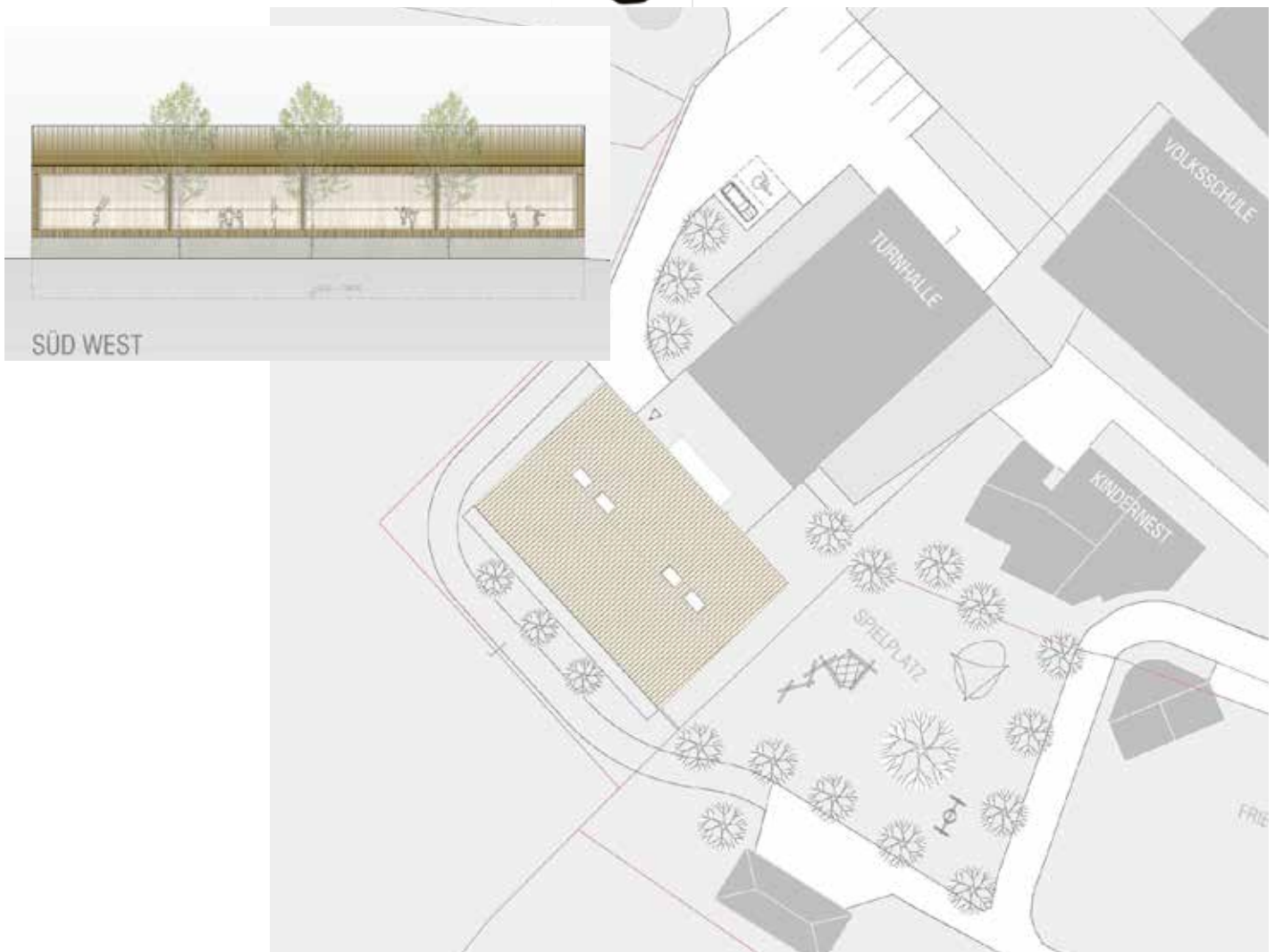
„Gstottbauer.architektur.werkstatt“ Planausschnitte aus dem Siegerprojekt „Neubau Kindergarten“