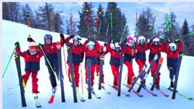
Der Alpine Nachwuchs hat sich gut vorbereitet und freut sich auf die Wintersaison 2024/25.