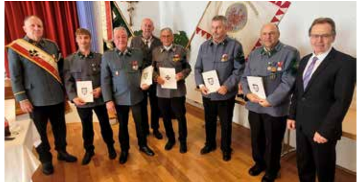
Die beförderten Veteranen.